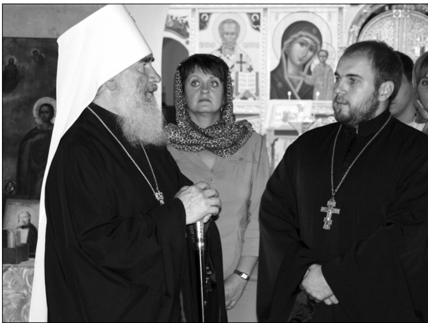
В храме Святой Живоначальной Троицы